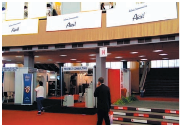
AFISARE BANNERE PAVILION A, FRIZA 4.50