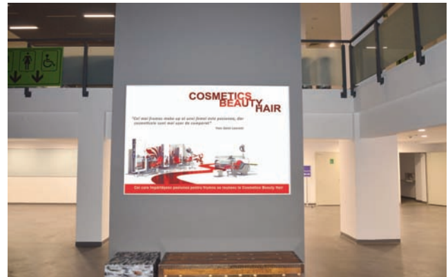
CASETA CU RAMA CLICK, DIMENSIUNE 200X140 CM